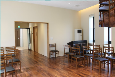
ヨセフ館の小聖堂