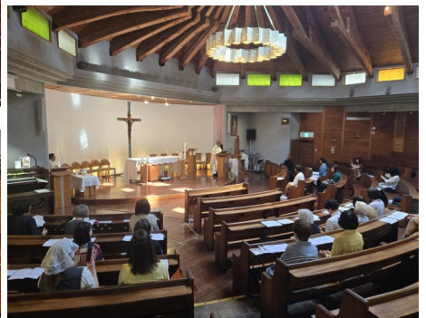
レジオマリエ名古屋クリア 浜松教会巡礼 5月16日