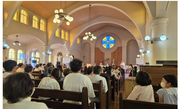
インターナショナルサ 教会学校 5月10日