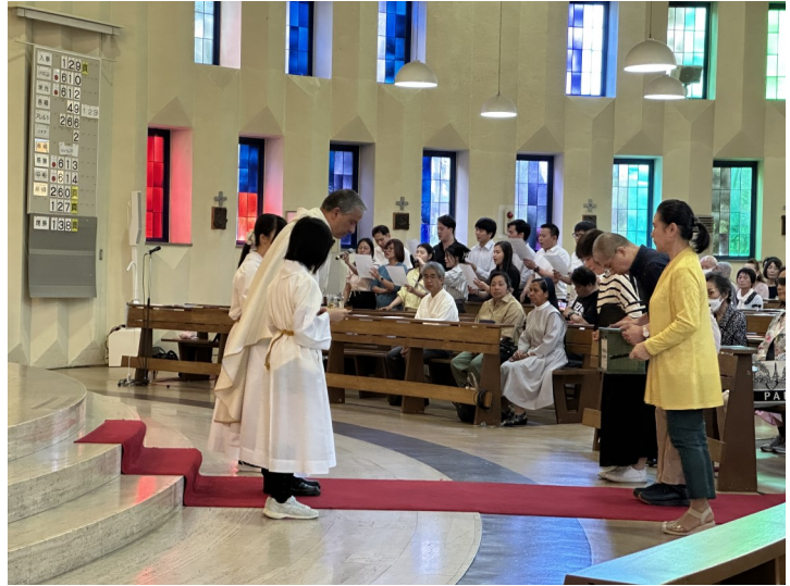
共同体合同ミサ 5月31日