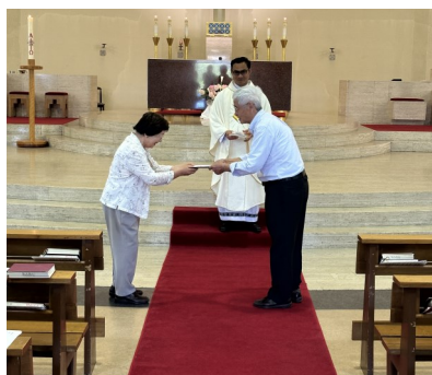
5月から始まった聖書リレー (各自で毎週創世記から2章ずつ聖書を読む取り組み)