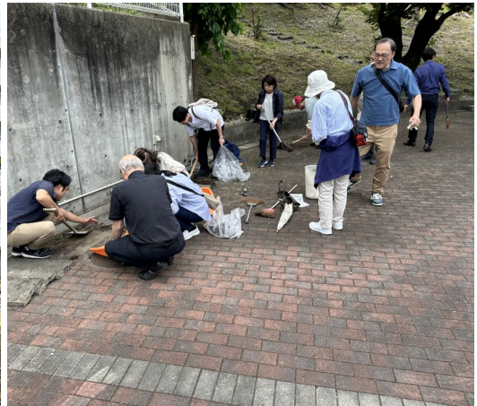
窓拭き・側溝清掃 5月31日