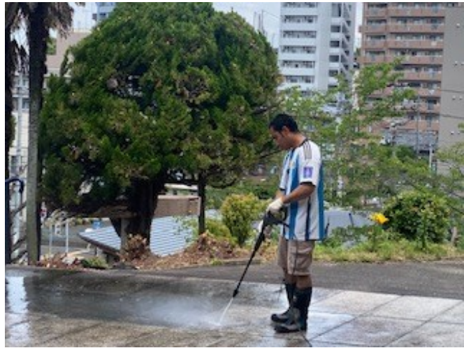
教会敷地内整備 ・ 聖堂前清掃