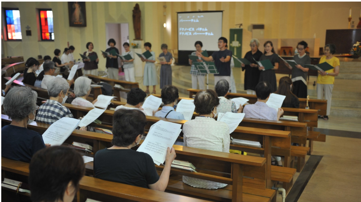
2024年8月4日 平和祈念の集い