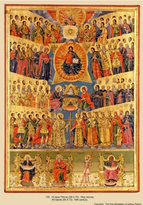
133. Οὐρανός Πάντες (50 X 72). 19ος αιώνας. All Saints (50 X 72). 19th century.

のような理解をしていたけると良いかと思えます。さてミカエルとミカエラ、フランシスコとフランシスカなど似ているけど微妙に違う名前が存在します。聖フランシスコの名前を女性に使う場合は語尾を女性形に直してフランシスカとします。聖ミカエルは同様にミカエラ、聖ガブリエルはガブリエラ。このことは大抵そうだと理解すると良いと思えます。絶対そうかという例外もあるからです。実際、聖マリアの名前は男性がいただけでもマリアのままです。教会の伝統的な掟の中には「たいてい」とか「おおむね」とか余裕を持たせてある事柄が割と存在します。