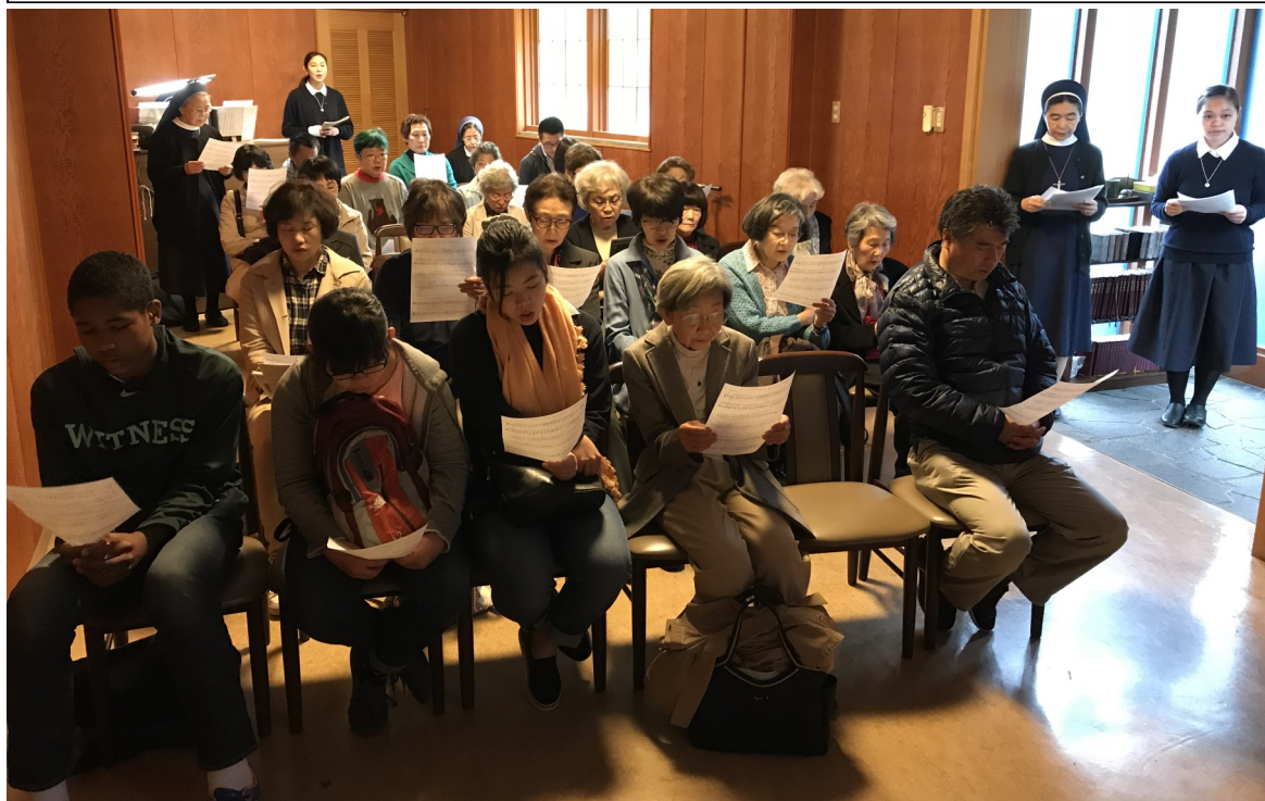
2018.4.15 賛美の集い (小聖堂)