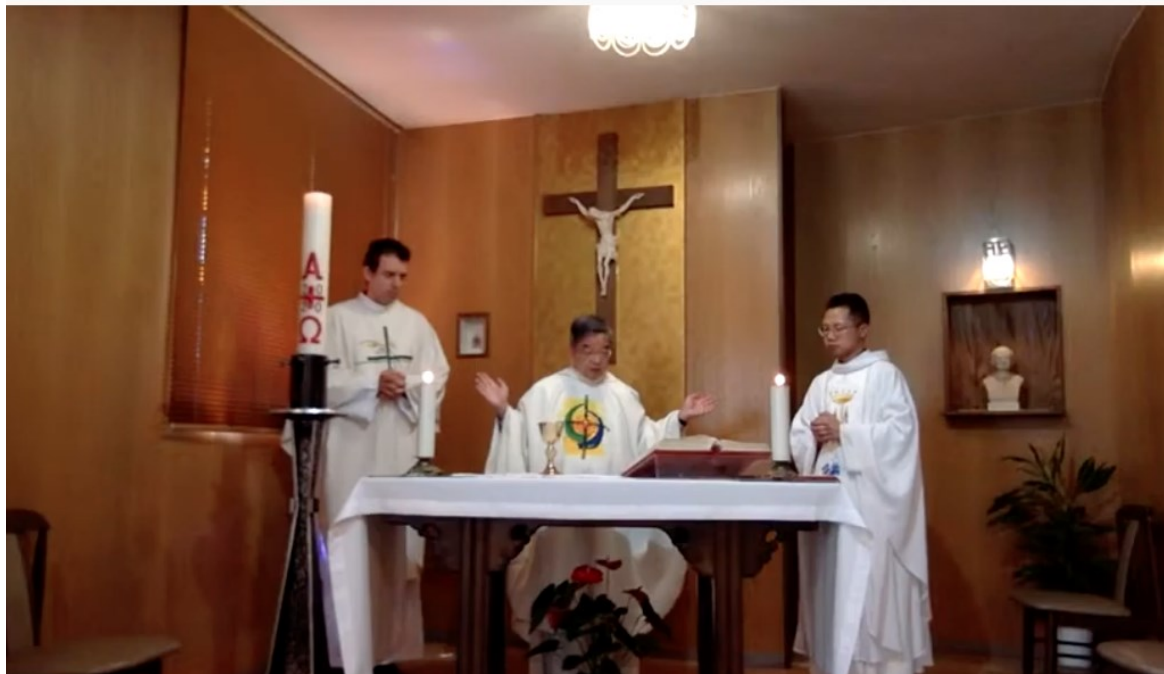
2020.5.17 伴師司式ミサ ライブ中継